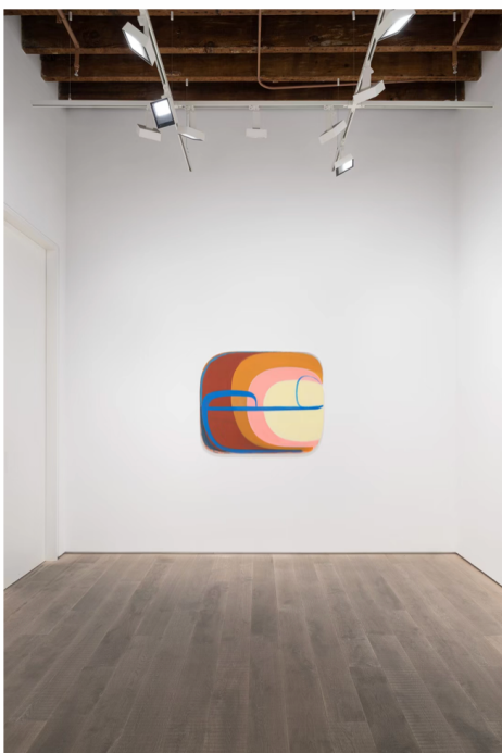
● “乔安娜·普赛-达特”展览现场，里森画廊，上海，2022年

边界，思想的转变就在这种微妙的移动中转变，而在这股转变之中，“运动”，始终处于核心位置。