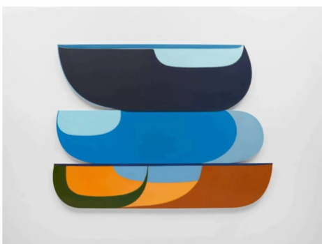
● 乔安娜·普赛-达特，《3 Part Variation #6》，丙烯颜料、木板和帆布，152.4 x 205.7 x 3.8 cm，2013年 © 乔安娜·普赛-达特，图片由里森画廊提供

今年在里森画廊上海空间举行的 Joanna Poussette-Dart 个展中，艺术家为此次展览特别