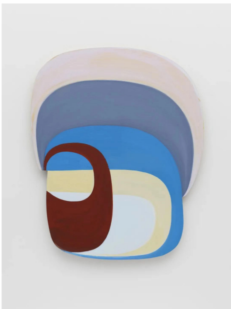
● 乔安娜·普赛-达特，《无题》，丙烯颜料、木板和层压依沃珑面料，91.4 x 76.2 x 2.5 cm，2022年 © 乔安娜·普赛-达特，图片由里森画廊提供，由 Mark Waldhauser 拍摄

放弃了矩形，转而使用弯曲不规则的方式，让 Joanna 的作品更像是一个个可以看得见风景的“窗户”了，但她并不愿意将自己为风景画家划上等号，对她而言：“这是更真实地表达我感知的手段，它使得我能够创造出更多体现环境的绘画，而不是仅仅是一张它们的‘图像’。”